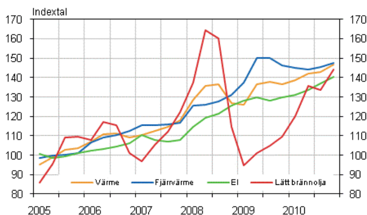
Figur 2. Kostnadsindex för fastighetsunderhåll 2005=100, Användning av el och värme

Från tredje kvartalet 2010 till fjärde kvartalet 2010 steg totalindexet med 1,2 procent.