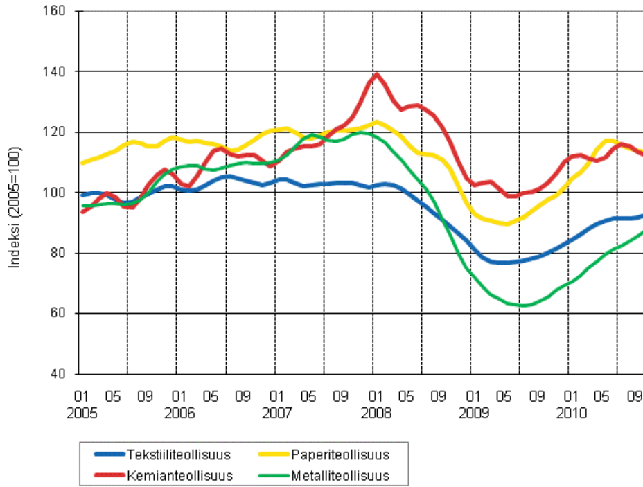
Liitekuvio 1. Teollisuuden uusien tilausten trendisarjat toimialoittain