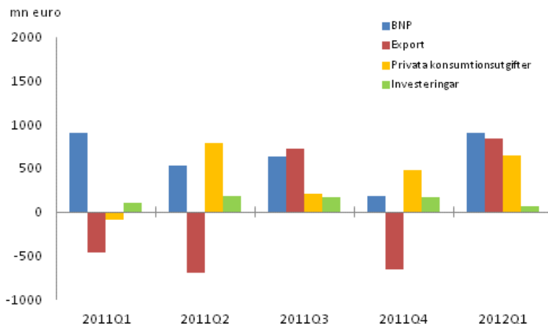
Figur 2. Förändringar i BNP och efterfrågeposterna från föregående kvartal (säsongrensat, löpande priser)

Exportvolymen ökade under januari–mars med 3,7 procent jämfört med föregående kvartal, men var 0,2 procent mindre än året innan. Exporten av varor ökade med 8,5 procent från föregående kvartal, men exporten av tjänster minskade med 9,7 procent.