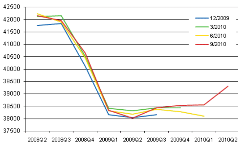
Figur 1. Revidering av den säsongrensade volymen av bruttonationalprodukten i kvartalsräkenskapernas publikationer

Också de övriga europeiska ekonomierna håller så småningom på att återhämta sig från recessionen. Enligt Eurostats preliminära uppgifter ökade bruttonationalprodukten inom EU-området med 1,0 procent under andra kvartalet jämfört med föregående kvartal och med 1,9 procent från året innan.